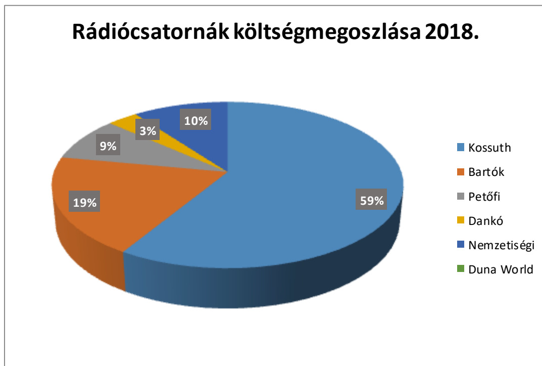
4. ábra – A közszolgálati média rádiós médiaszolgáltatásainak költségmegoszlása (2018)

A Duna World Rádió esetében mindössze a csatorna működtetéséhez szükséges HR költségek jelennek meg a kiadási oldalon, ezek a tavalyi évben 38 millió forinttal terhelték a költségvetést.